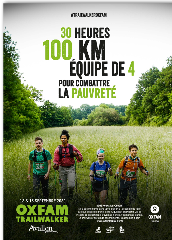
Affiche Trailwalker Avallon 2020